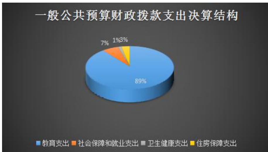
(图6：一般公共预算财政拨款支出决算结构)

2022年一般公共预算财政拨款支出7,269.34万元，主要用于以下方面：教育支出6,485.98万元，占89.2%；社会保障和就业支出459.95万元，占6.3%；卫生健康支出87.6万元，占1.2%；住房保障支出235.8万元，占3.2%。