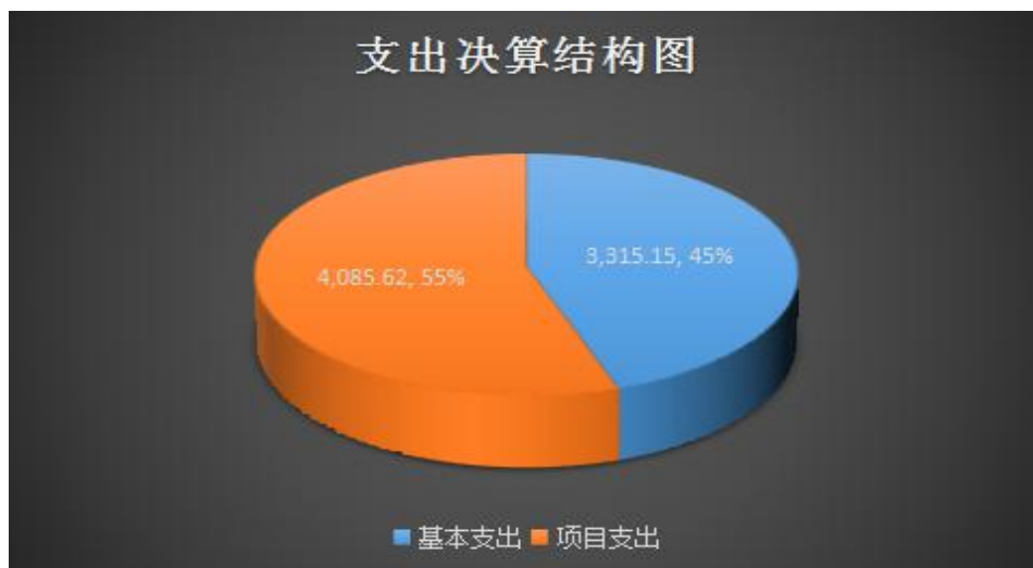
（图3：支出决算结构图）

2022年本年支出合计7,400.76万元，其中：基本支出3,315.15万元，占44.8%；项目支出4,085.62万元，占55.2%；上缴上级支出0万元，占0%；经营支出0万元，占0%；对附属单位补助支出0万元，占0%。